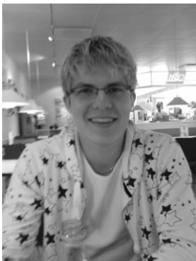
Thomas Jensen Thyholm IF