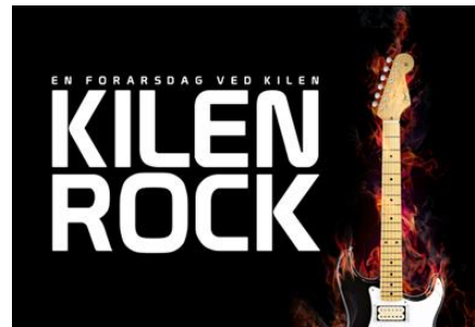
Kilen Rock Struer