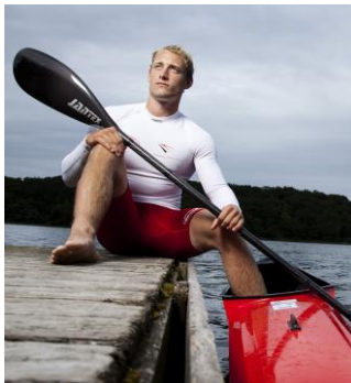
Jimmy Bøjesen Struer Kajakklub