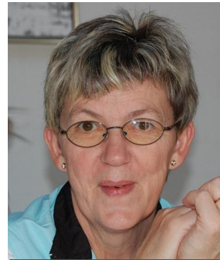
Nelly Korsgaard Thyholm Idrætsforening